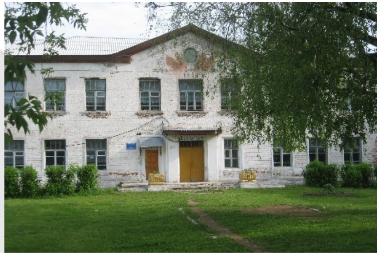
Нижегородская (Горьковская) область, Сеченовский район, село Верхнее Талызино.