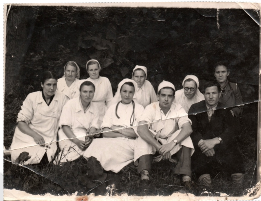
1961 год. Горьковская область. Сеченовский район. Коллектив Верхне-Талызинской районной больницы