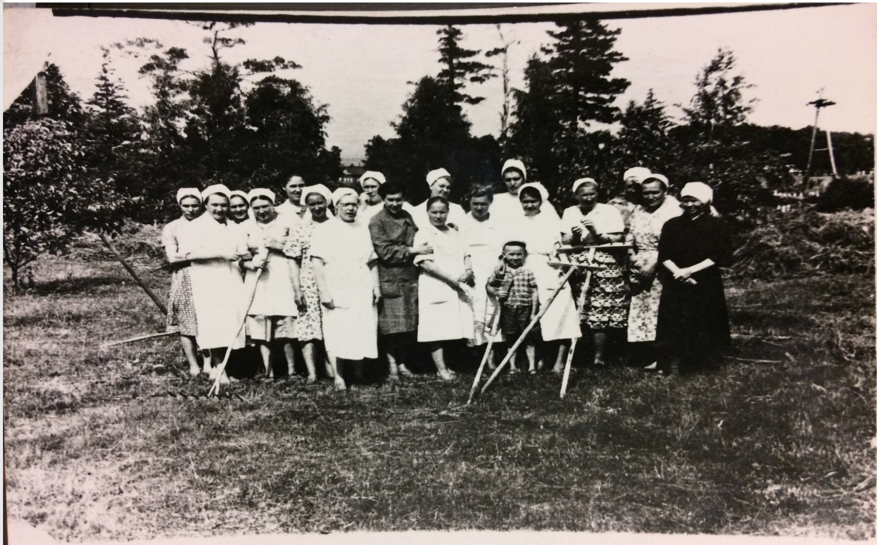
На субботнике. Коллектив Верхне-Талызинской районной больницы.