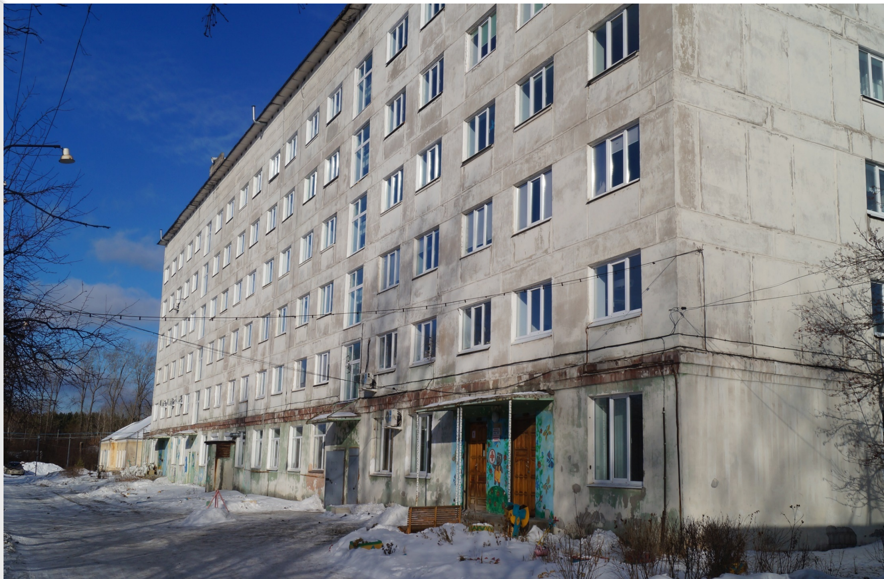
Здание главного корпуса городской инфекционной больницы г. Нижний Тагил. Дата открытия больницы 01.01.1976 г.