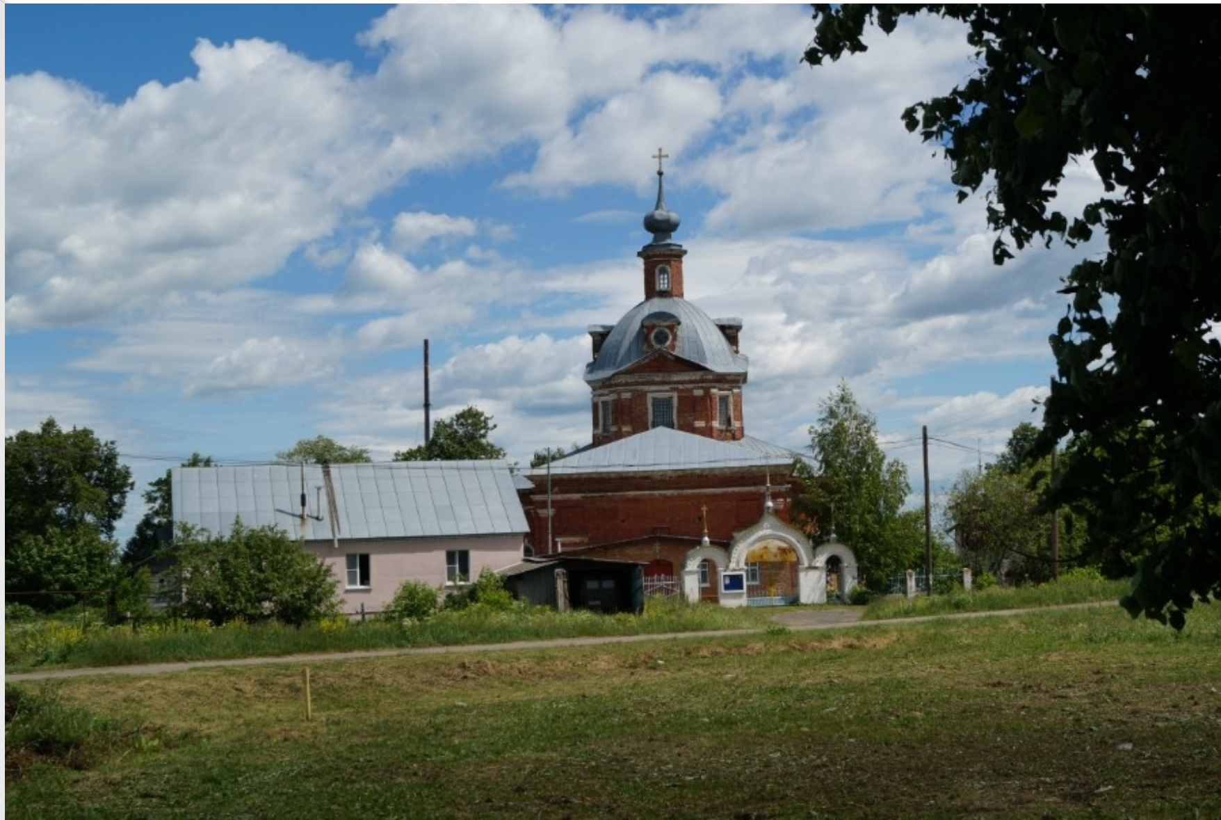
Нижегородская (Горьковская) область, Сеченовский район, село Верхнее Талызино, наши дни.